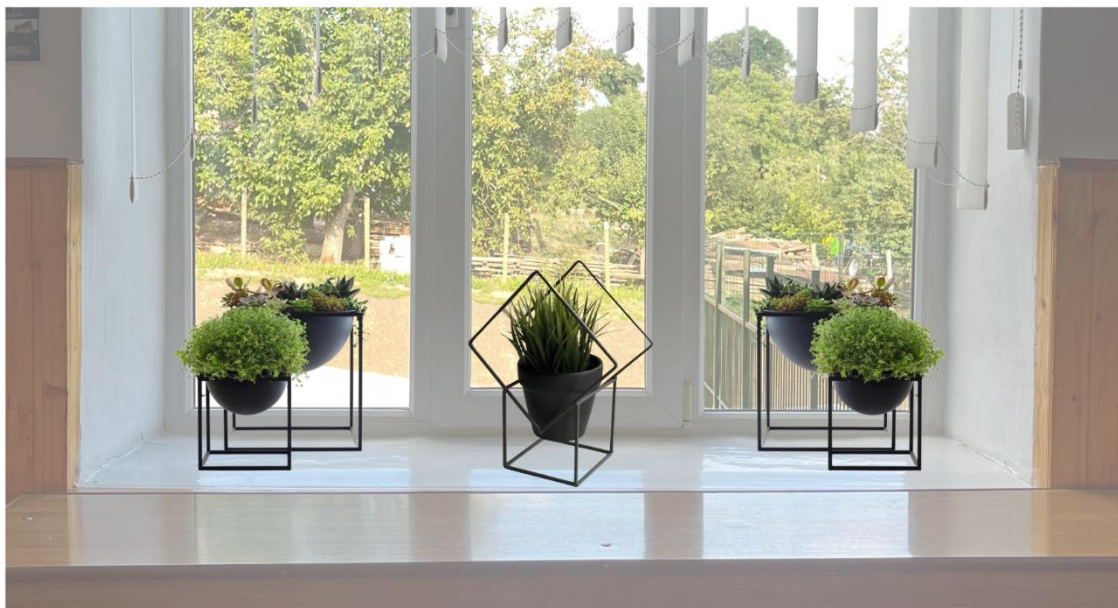
2. Настільні підставки для вазонів разом із рослинністю.